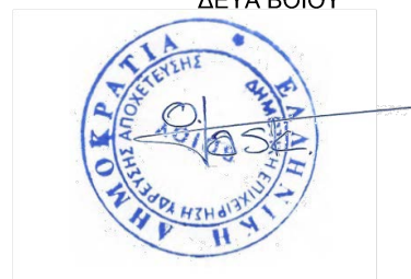
ΟΛΥΜΠΙΑ ΤΑΣΚΑΡΗ ΠΟΛΙΤΙΚΟΣ ΜΗΧΑΝΙΚΟΣ ΠΕ

Η ΠΡΟΪΣΤΑΜΕΝΗ ΤΗΣ ΤΕΧΝΙΚΗΣ ΥΠΗΡΕΣΙΑΣ ΔΕΥΑ ΒΟΪΟΥ