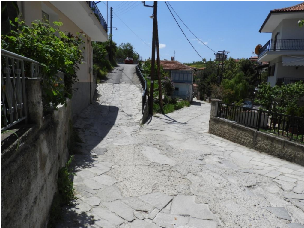
Εικόνα 3-16: Υφιστάμενη κατάσταση (διασταύρωση Κυρά Σανούκως – Πλατεία Ελευθερίας)