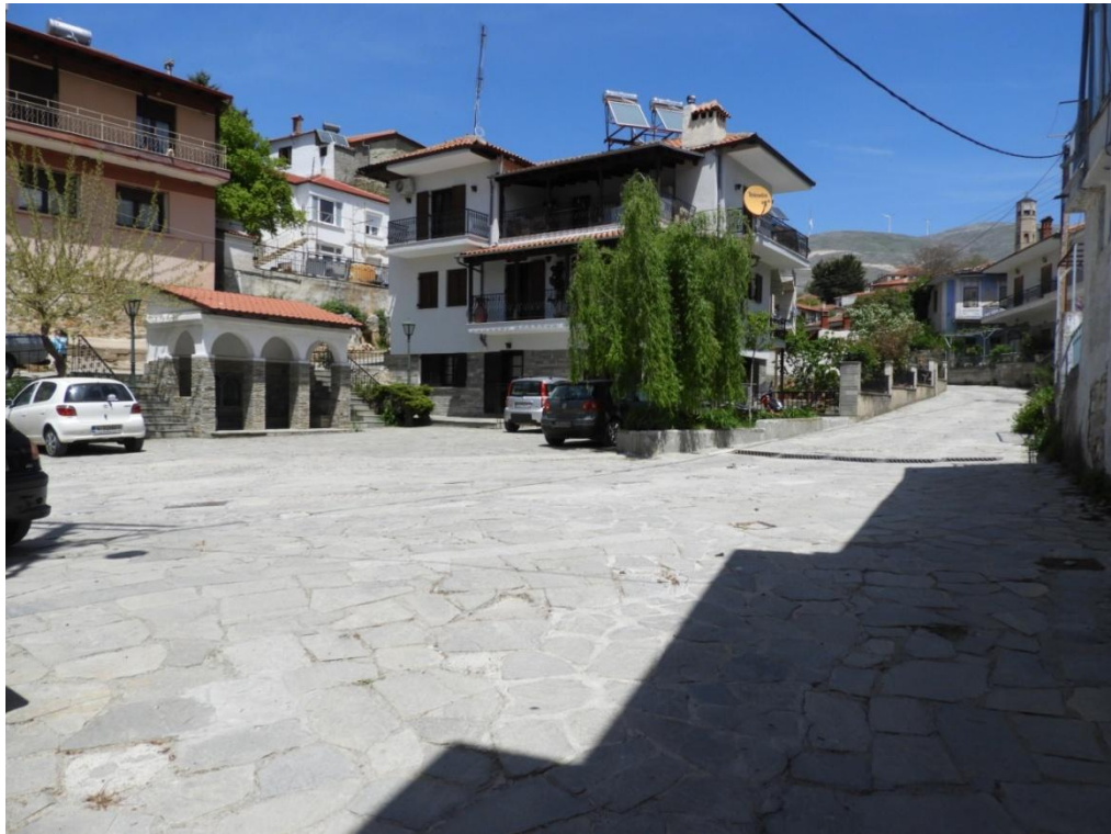
Εικόνα 3-20: Υφιστάμενη κατάσταση Πλατεία Ελευθερίας