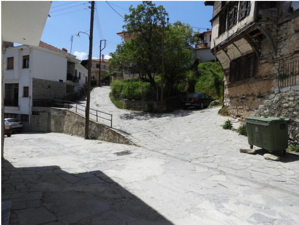
Εικόνα 3-9: Υφιστάμενη κατάσταση (διασταύρωση οδών Αναστασίου Τσίπου – Φιλικής Εταιρίας)