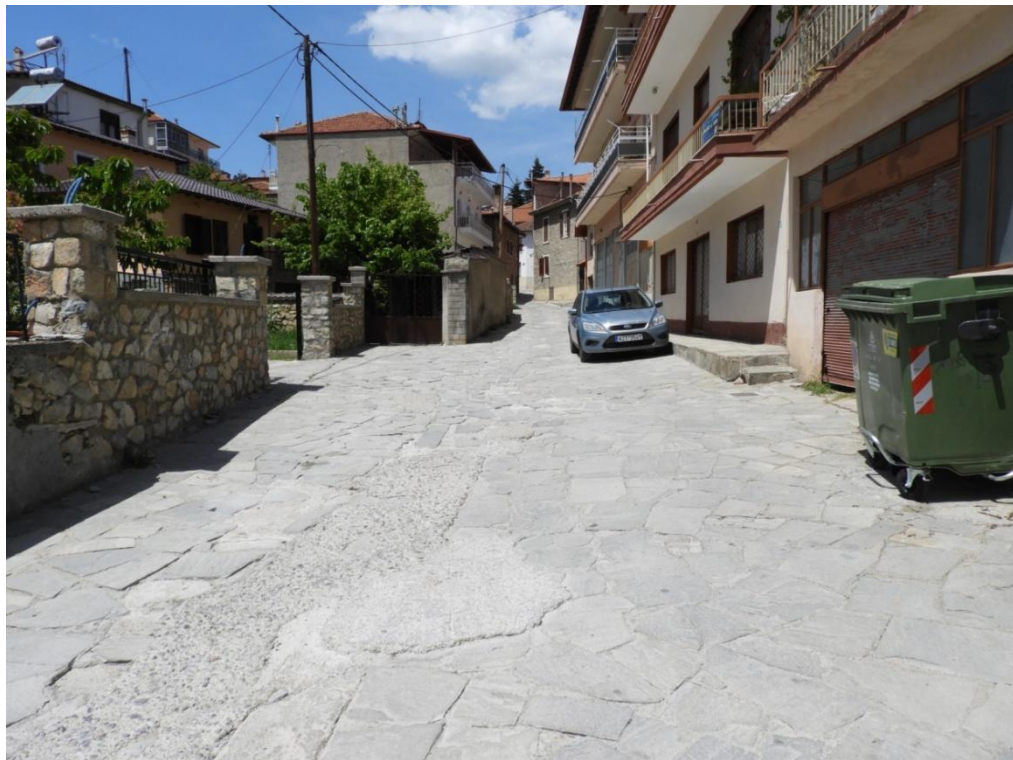
Εικόνα 3-6: Υφιστάμενη κατάσταση (οδός Αναστασίου Τσίπου)