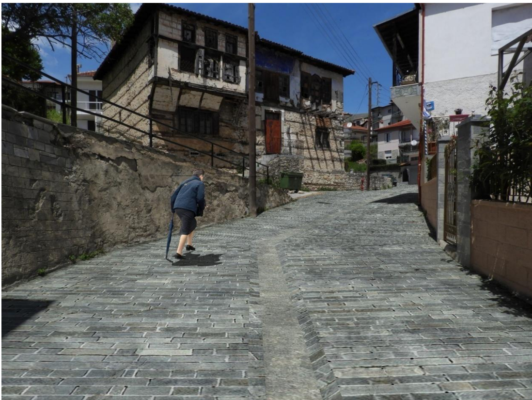
Εικόνα 5-6: Πρόταση διαμόρφωσης, Οδός Αν. Τσίπου (Αρχοντικό Τζιουρά).