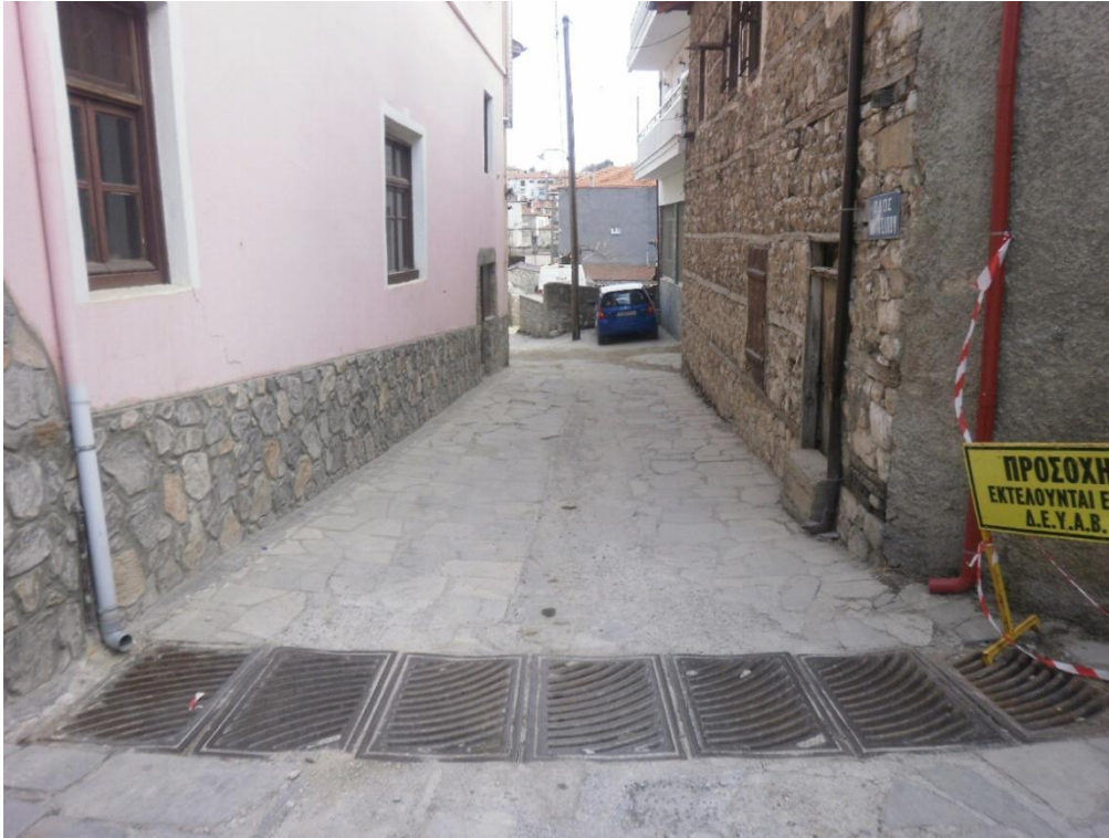
Εικόνα 3-1: Αρχή περιοχή παρέμβασης (Οδός Αναστασίου Τσίπου)

φθορές του χρόνου και της ακαταλληλότητας της υφιστάμενης πλακόστρωσης να αντέξει την κίνηση των αυτοκινήτων, είτε σε έργα υποδομών για ύδρευση, ηλεκτροφωτισμού κλπ.