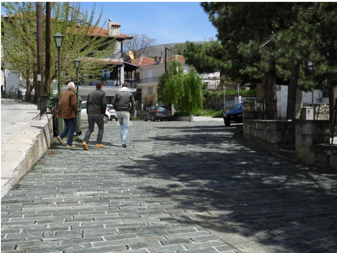
Εικόνα 5-8: Πρόταση διαμόρφωσης οδού έμπροσθεν Πλατείας Ελευθερίας