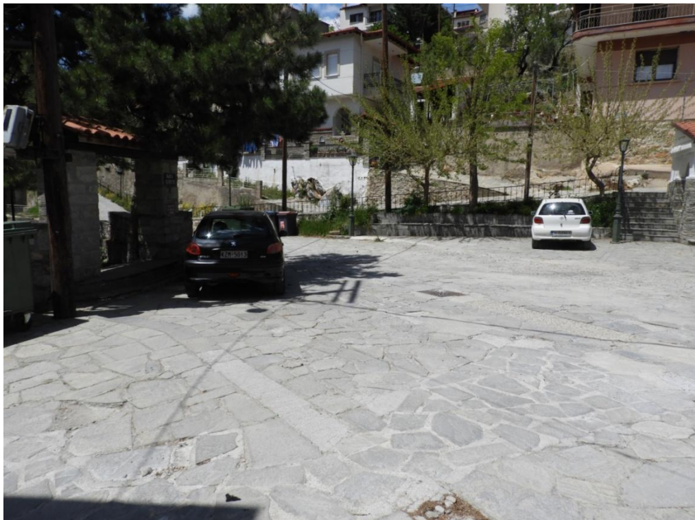
Εικόνα 3-19: Υφιστάμενη κατάσταση Πλατεία Ελευθερίας