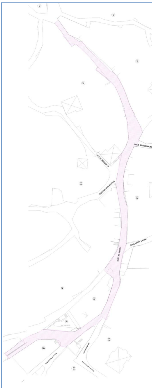
Εικόνα 2-2: Περιοχή παρέμβασης

ΟΙΚΙΣΜΟ ΣΙΑΤΙΣΤΑΣ ΔΗΜΟΥ ΒΟΪΟΥ», που θα χρηματοδοτηθεί από το Επιχειρησιακό Πρόγραμμα «Δυτική Μακεδονία 2014-2020» (Εικόνα 2-1).