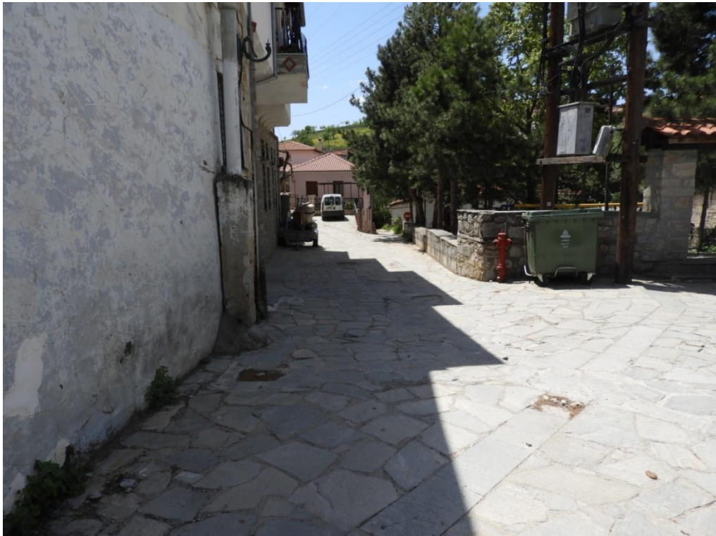
Εικόνα 3-18: Υφιστάμενη κατάσταση Πλατεία Ελευθερίας