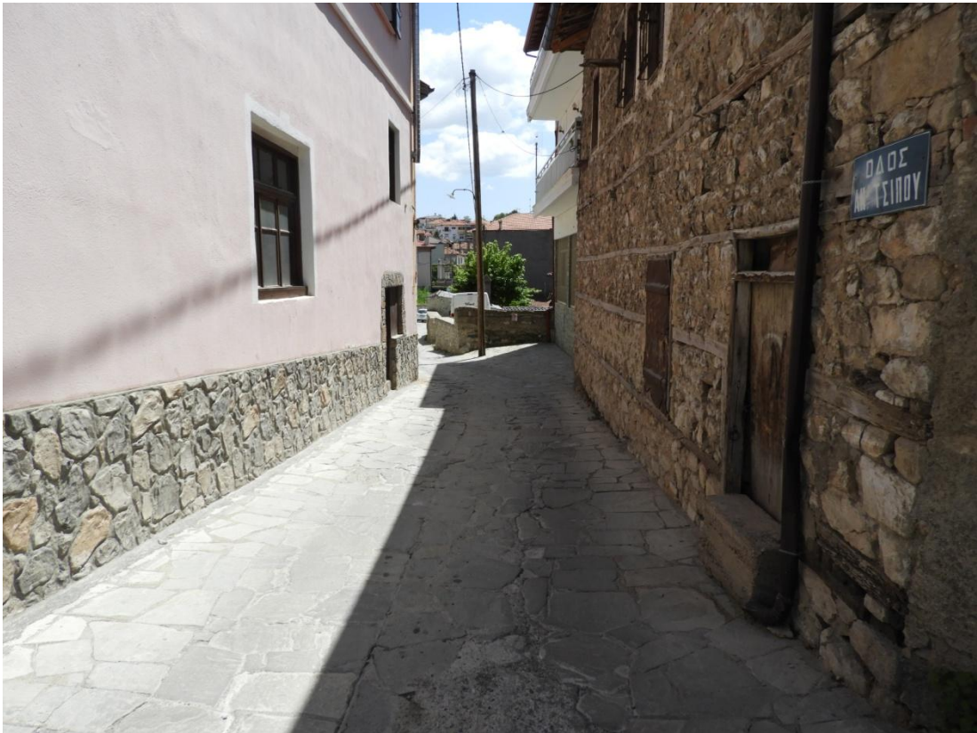
Εικόνα 5-3: Υφιστάμενη κατάσταση Οδός Αν. Τσίπου