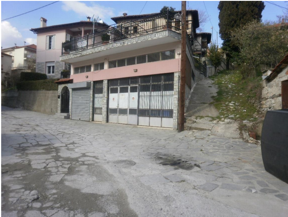
Εικόνα 3-5: Υφιστάμενη κατάσταση, διασταύρωση οδών Αναστασίου Τσίπου – Ρούζιου Θ.