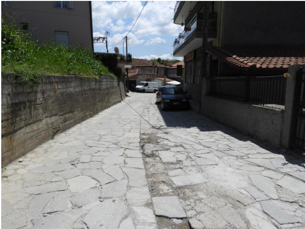
Εικόνα 3-3: Υφιστάμενη κατάσταση (οδός Αναστασίου Τσίπου)