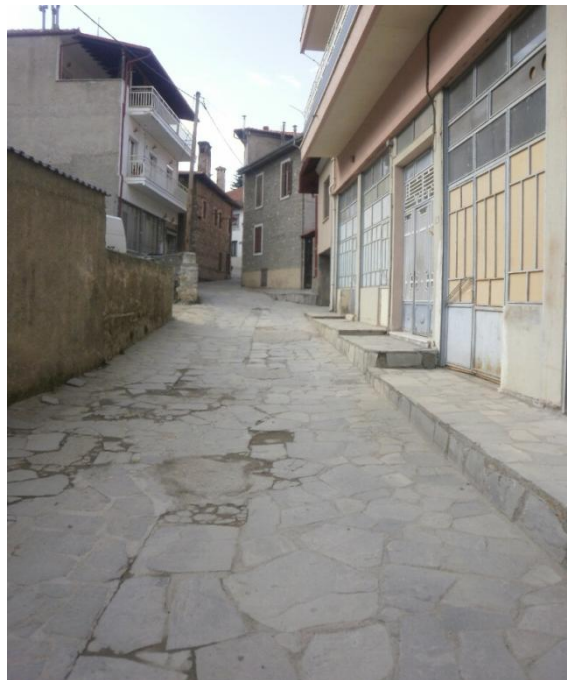
Εικόνα 3-2: Υφιστάμενη κατάσταση (οδός Αναστασίου Τσίπου)