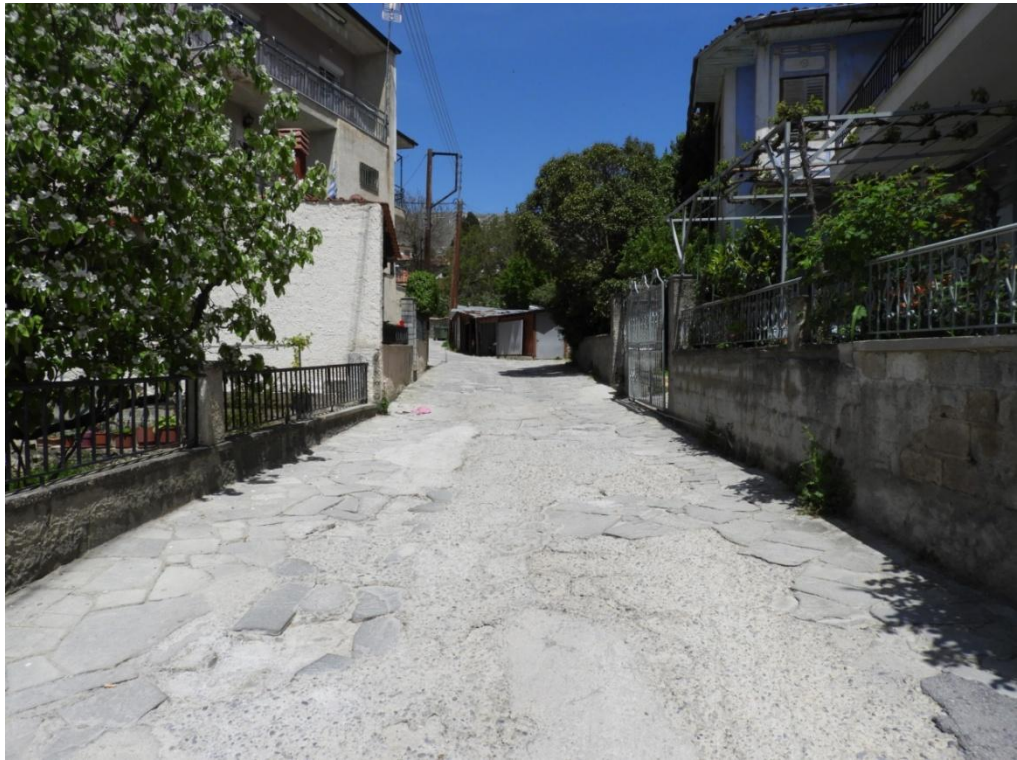
Εικόνα 3 22: Υφιστάμενη κατάσταση Οδός Αναστασίου Τσίπου