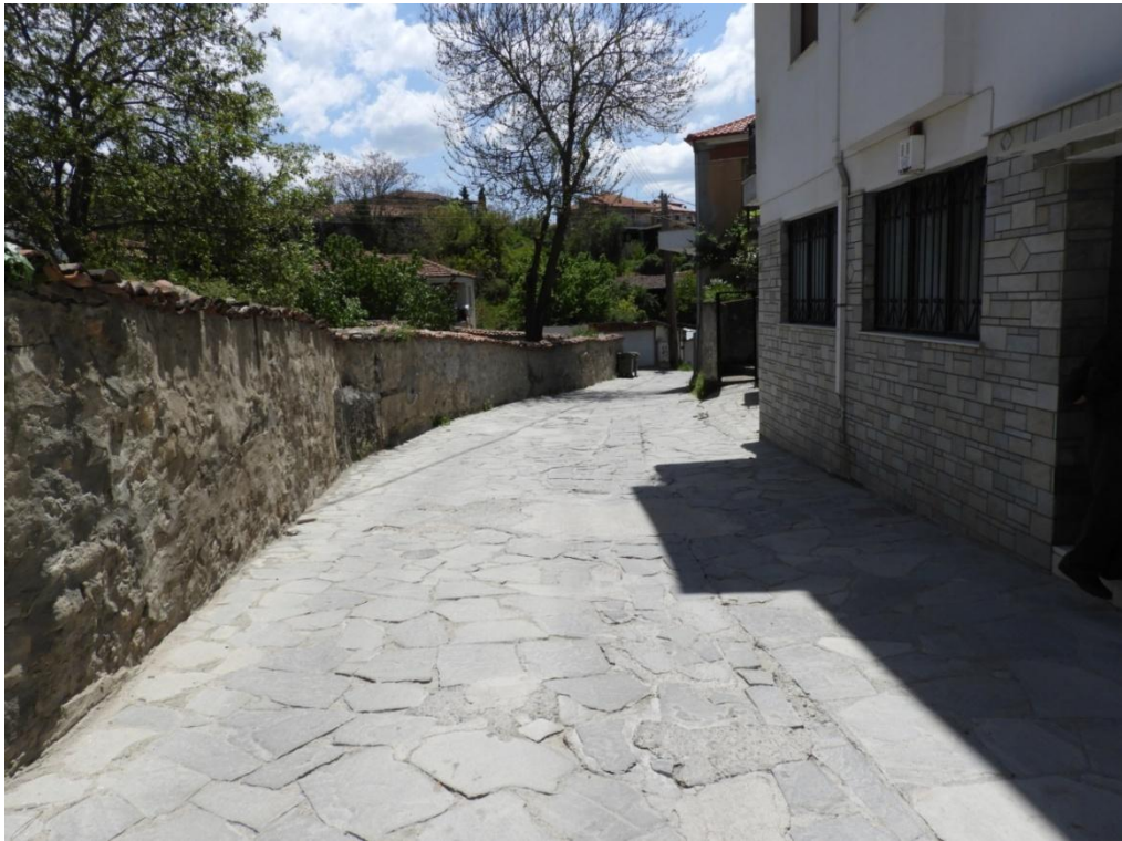
Εικόνα 3-11: Υφιστάμενη κατάσταση (οδός Αναστασίου Τσίπου – Αρχοντικό Γκερεχτέ)