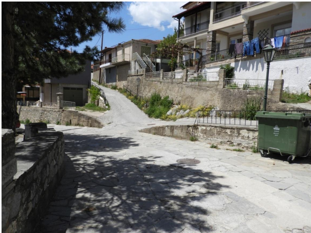
Εικόνα 3-21: Υφιστάμενη κατάσταση Πλατεία Ελευθερίας (προς Οδό Κωνσταντίνου Παλαιολόγου)