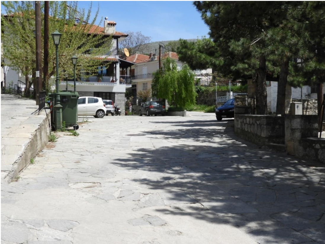
Εικόνα 5-7: Υφιστάμενη κατάσταση οδού έμπροσθεν Πλατείας Ελευθερίας