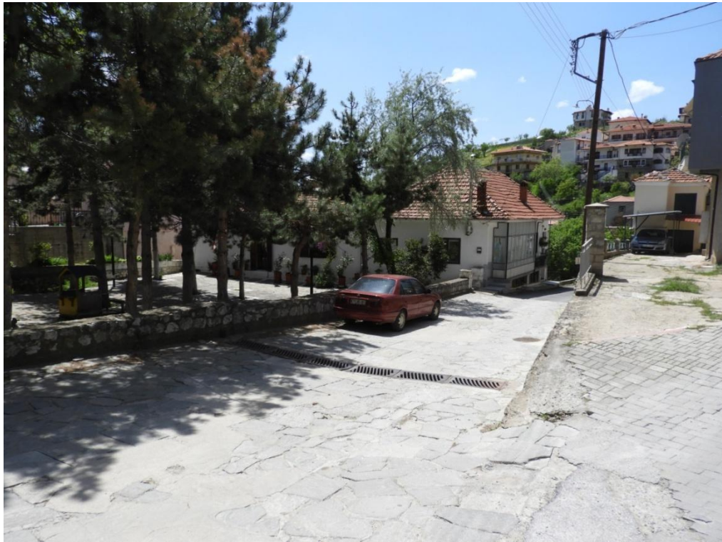
Εικόνα 3-22: Υφιστάμενη κατάσταση Πλατεία Ελευθερίας (προς Οδό Μπούνου)