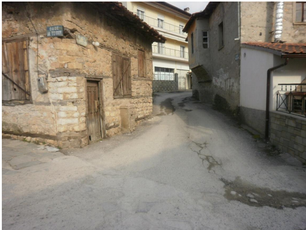
Εικόνα 3-8: Υφιστάμενη κατάσταση (διασταύρωση οδών Αναστασίου Τσίπου με Μακεδονομάχων)