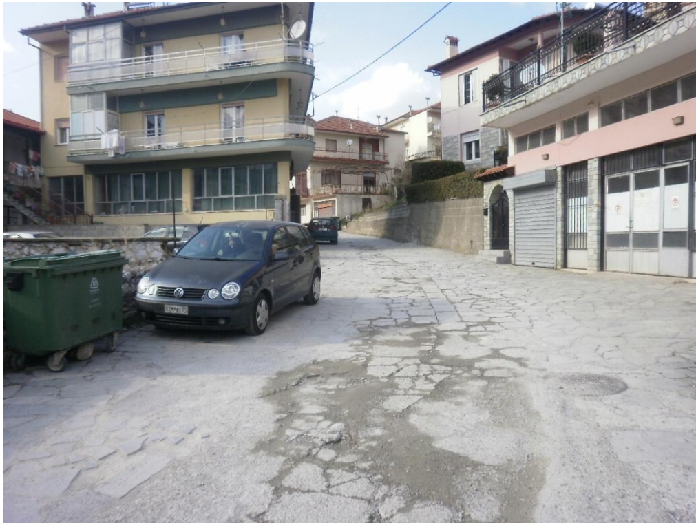
Εικόνα 3-7: Υφιστάμενη κατάσταση (οδός Αναστασίου Τσίπου)