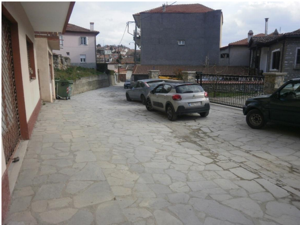
Εικόνα 3-4: Υφιστάμενη κατάσταση (οδός Αναστασίου Τσίπου)