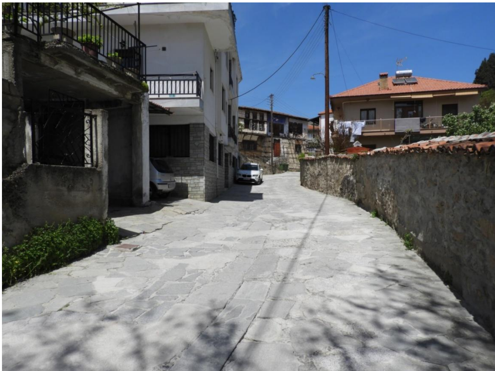
Εικόνα 3-12: Υφιστάμενη κατάσταση (οδός Αναστασίου Τσίπου – Αρχοντικό Γκερεχτέ)