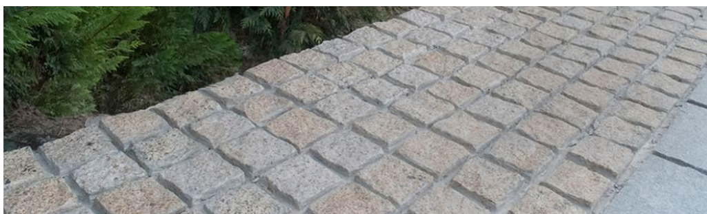
Εικόνα 5-2: Όψη αρμών γρανιτο-κυβόλιθου 10Χ10Χ5 μπεζ απόχρωσης