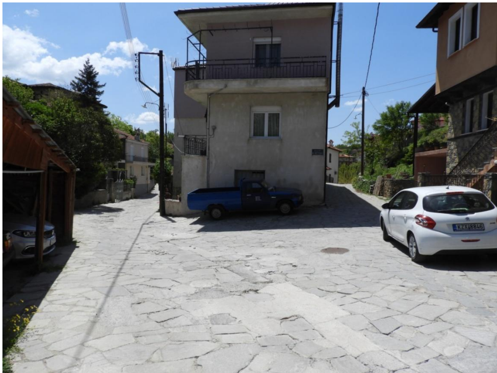
Εικόνα 3-14: Υφιστάμενη κατάσταση (διασταύρωση οδός Αναστασίου Τσίπου – Βόγγολη)