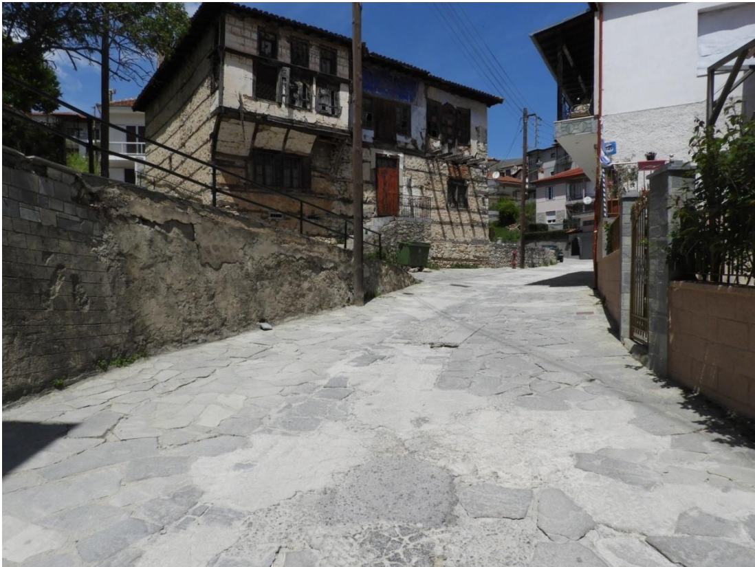
Εικόνα 5-5: Υφιστάμενη κατάσταση, Οδός Αν. Τσίπου (Αρχοντικό Τζιουρά).