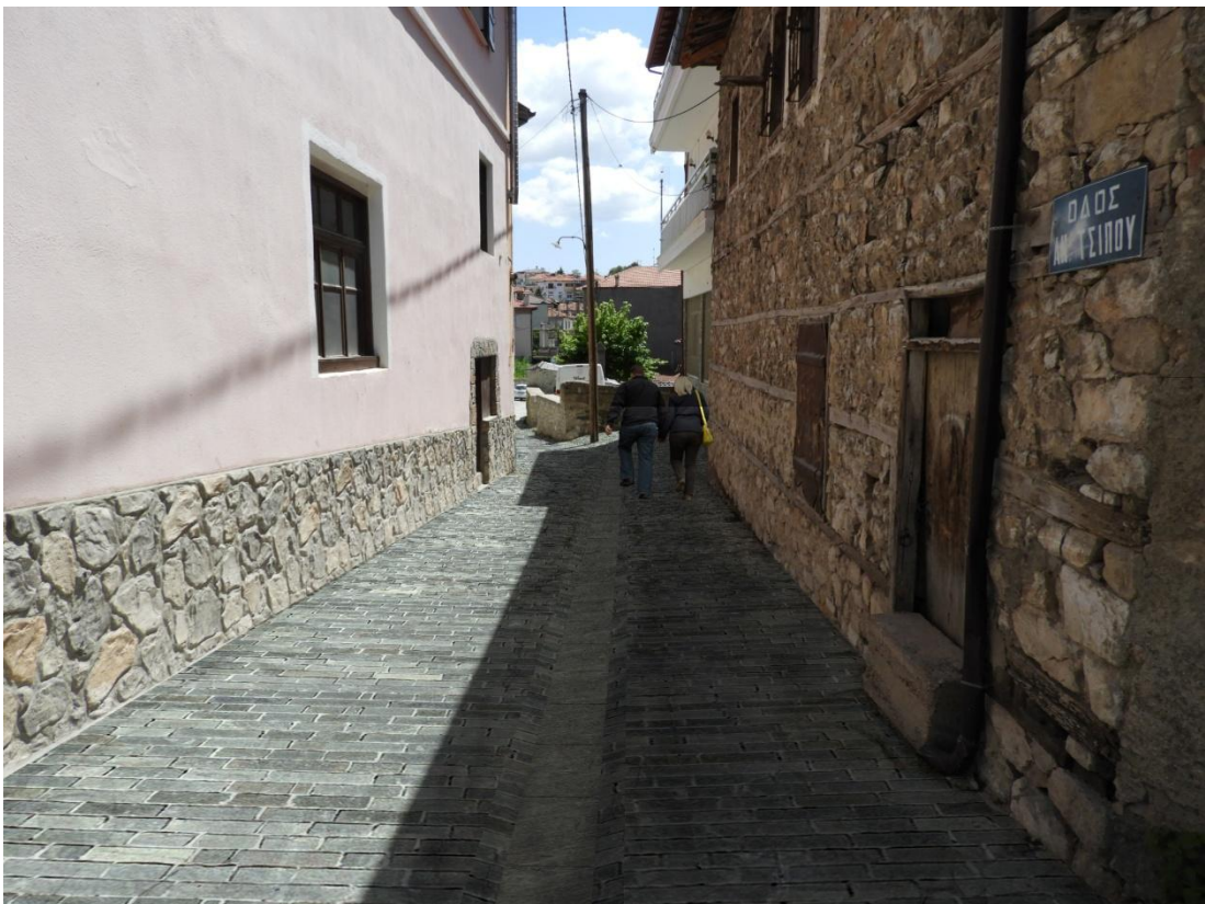
Εικόνα 5-4: Πρόταση διαμόρφωσης Οδός Αν. Τσίπου