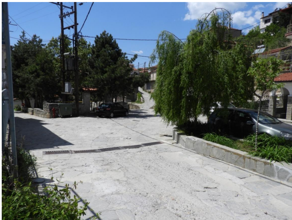
Εικόνα 3-17: Πλατεία Ελευθερίας