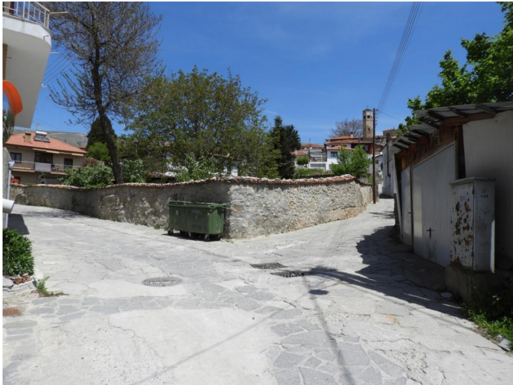
Εικόνα 3-13: Υφιστάμενη κατάσταση (διασταύρωση οδός Αναστασίου Τσίπου – Μητροπολίτη Δανιήλ)