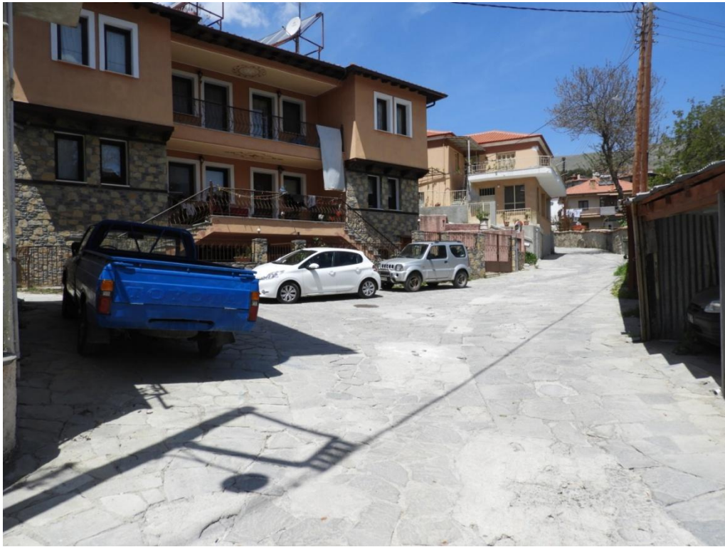
Εικόνα 3-15: Υφιστάμενη κατάσταση Οδός Αναστασίου Τσίπου